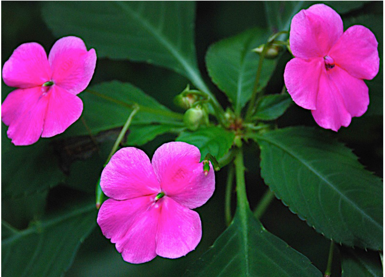
Flè Miramelinda/Fleur Miramelinda/Miramelinda Flower

Après ça, y a la mache ankò epi yo wè tout kalite plant, tankou yon flè ki rele miramelinda ak anpil bèt tout kote. Yo wè tout kalite bèt tankou : ensèk, zwazo, krapo, zandolit, mabouya.