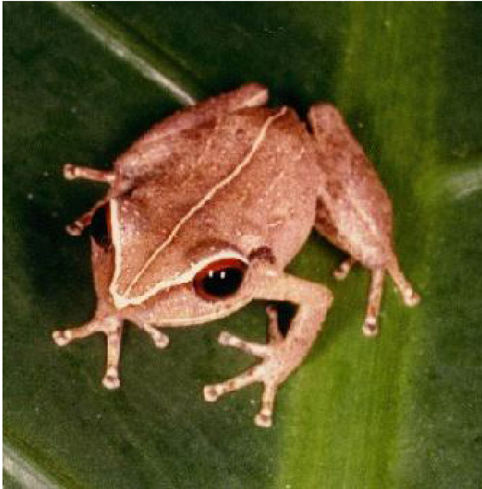
Krapo koki /Grenouille coquí/Coquí frog

Solèy la vin ap kouche, twa zanmi yo al pran machin yo epi yo kondwi tounen lakay yo avèk lespwa y ap tounen yon lòt lè pou reviv bèl esperyans sa ankò.